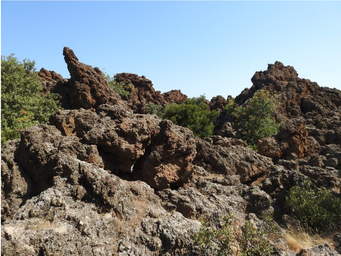
Vulkaanlandschap op Methana

Afhankelijk van het aantal deelnemers gaan we per auto of busje naar het schiereiland Methana. We lopen over een smal pad door een bijzonder landschap naar een vulkaan. We lunchen in een kleine taverne in een dorpje in de buurt van de vulkaan.