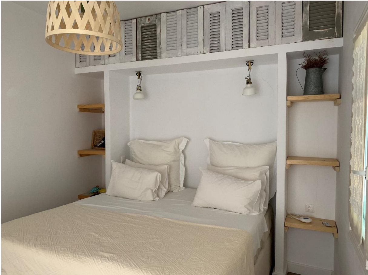
Eén van de kamers in Odyssey

De kamers in het hotel zijn voorzien van een eigen badkamer, Wifi, koelkast, verwarming en airconditioning. Bij alle kamers is een balkon of terras met zitje. De kamers zijn recent gerenoveerd, prachtig ingericht en hebben allemaal hun eigen karakter.