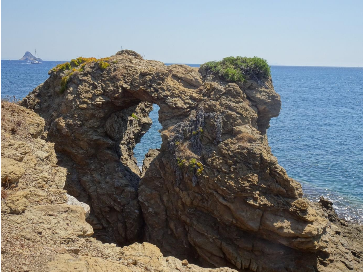
Rotsen op het schiereiland bij Alikibeach

Daar kunnen we in het toeristenseizoen in een kleine taverne aan zee lunchen, als de taverne nog niet open is nemen we een lunch mee. Dit is een makkelijke wandeling zonder veel hoogteverschil. Heeft iedereen nog energie en zin voor een zwaardere wandeling dan lopen we de heuvels achter Galatas in, voor weer een prachtig uitzicht over de omgeving en nemen een lunchpakket mee. Ook is er hier kans dat we een schildpad zien.